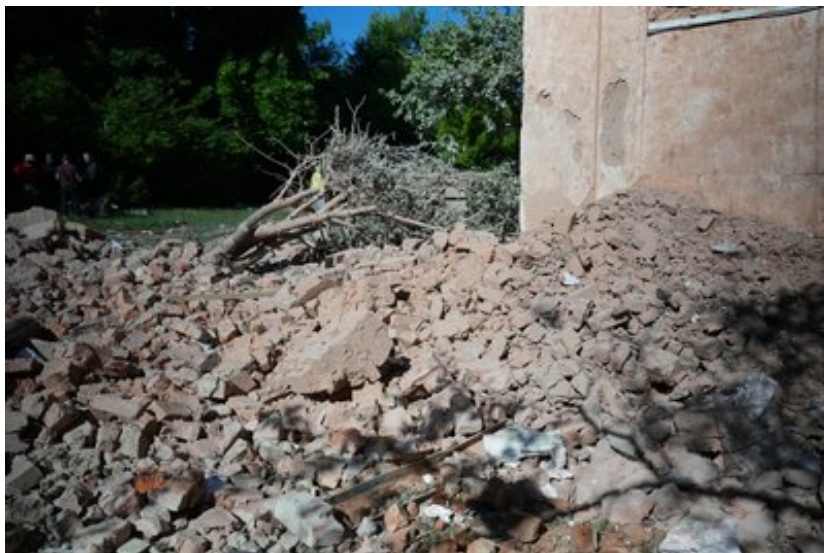
Наслідки влучання по Сумах 11 серпня.

11 серпня — ракетний обстріл Сум. В той день військові РФ вдарили по об'єктах інфраструктури міста. Були поранені вісім людей, повідомила Сумська міська рада. Вибуховою хвилею пошкоджено житловий двоповерховий будинок.