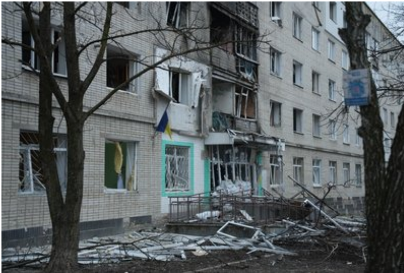
Обстріл Сум 6 березня.

Вперше у 2024 російські боеприпаси впали на обласний центр 6 березня. У той день війська РФ атакували Суми "шахедами". Зафіксували три влучання у різних частинах міста. Під ударом опинилася житлова п'ятиповерхівка по вулиці Паркова.