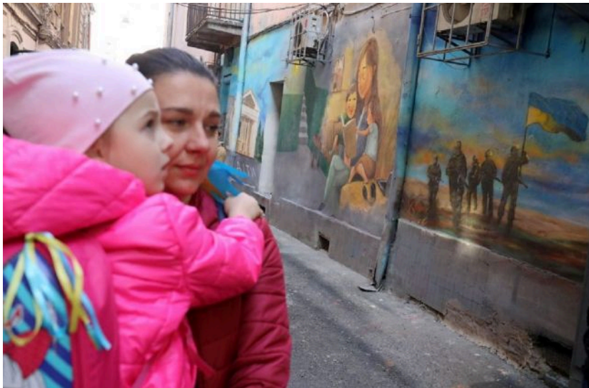
Фото: у Львові відкрили мурал, присвячений Маріуполю