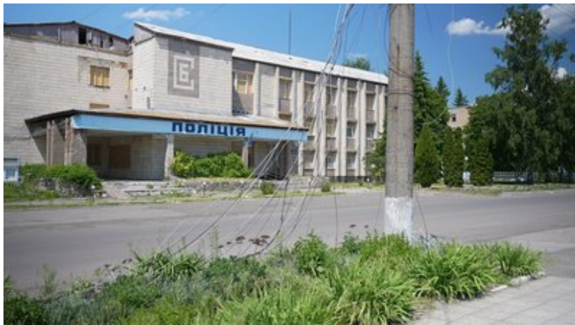
Велика Писарівка, Сумська область, травень, 2024 р.