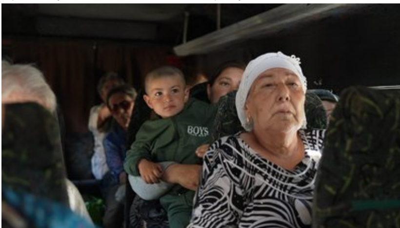
Мешканці Білопілья під час евакуації з міста, Сумська область, 21 червня, 2024 р.