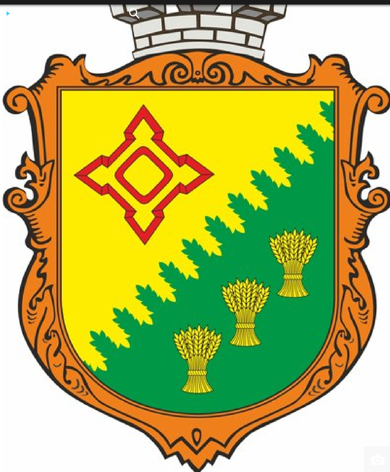
Малий герб Златопільської громади. Микола Бакшеев/Facebook

"Фортеця — це саме те, де вони живуть. Це — одна з фортець Української оборонної лінії ? , вона розташована на території Златополя", — сказав міський голова Суспільному.