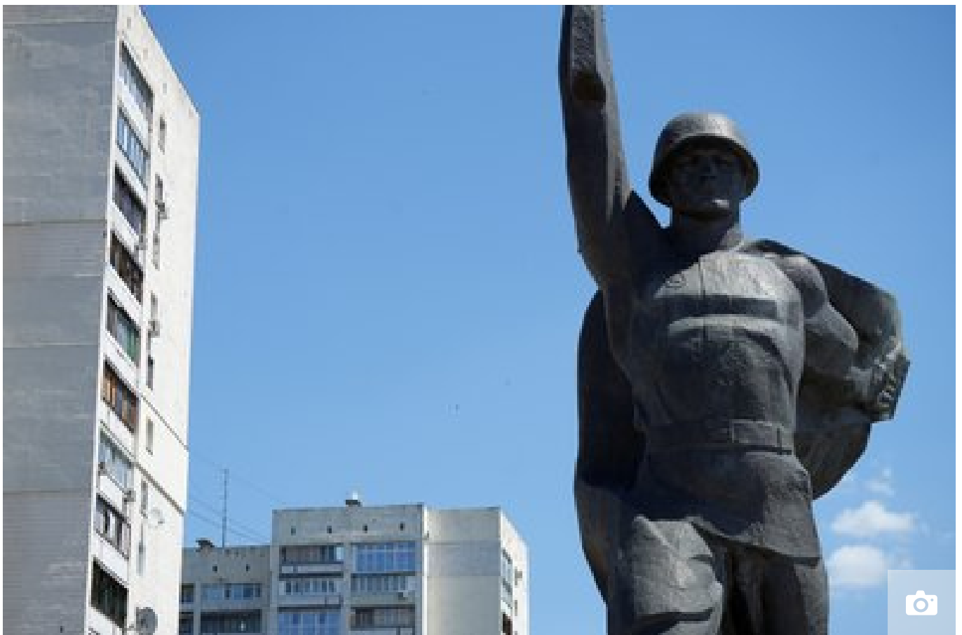
Пам'ятник радянським воїнам-визволителям біля метро "23 серпня", червень 2024 року, Харків.

"Вони перекладають це на Київ. Я не впевнений, на жаль, що Київ надасть ці рекомендації. Але будемо сподіватися. Можемо взяти до прикладу такий самий величезний радянський монумент солдату в Рівному, який було знесено, аналогічний знесено в Ужгороді. Готується до демонтажу — теж подали документи в Мінкульт — у Хмельницькому. У Вінниці також знесли монумент із радянськими солдатами", — каже Поздняков.