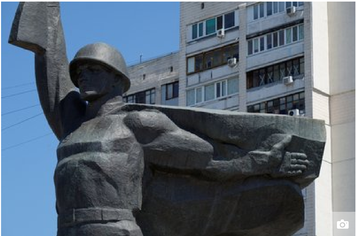
Пам'ятник радянським воїнам-визволителям біля метро "23 серпня", червень 2024 року, Харків.

"Спочатку позбавляють статусу пам'ятки — щодо місцевого значення — це Міністерство культури; національного значення — Кабмін. А потім уже на місці його можна демонтувати, переносити. Це така аксіома", — каже Костін.