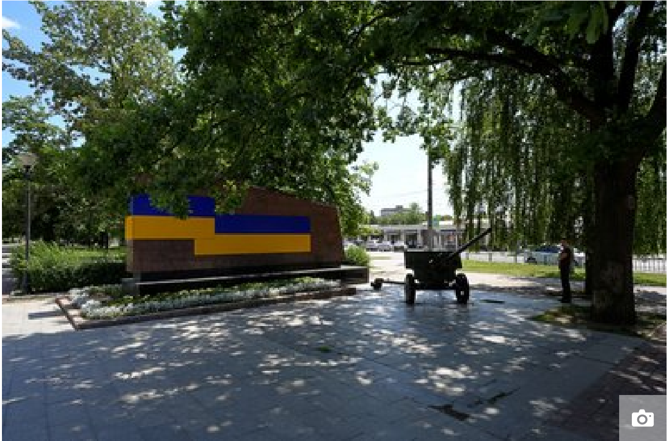
Стела біля Пам'ятник радянському солдату, червень 2024 року, Харків.

Пам'ятник радянським воїнам-визволителям, за словами Тахтаулової, не містить виключно радянську символіку, сам солдат увічніює пам'ять про боротьбу з нацизмом, відтак демонтажу, скоріш за все, не підлягатиме.