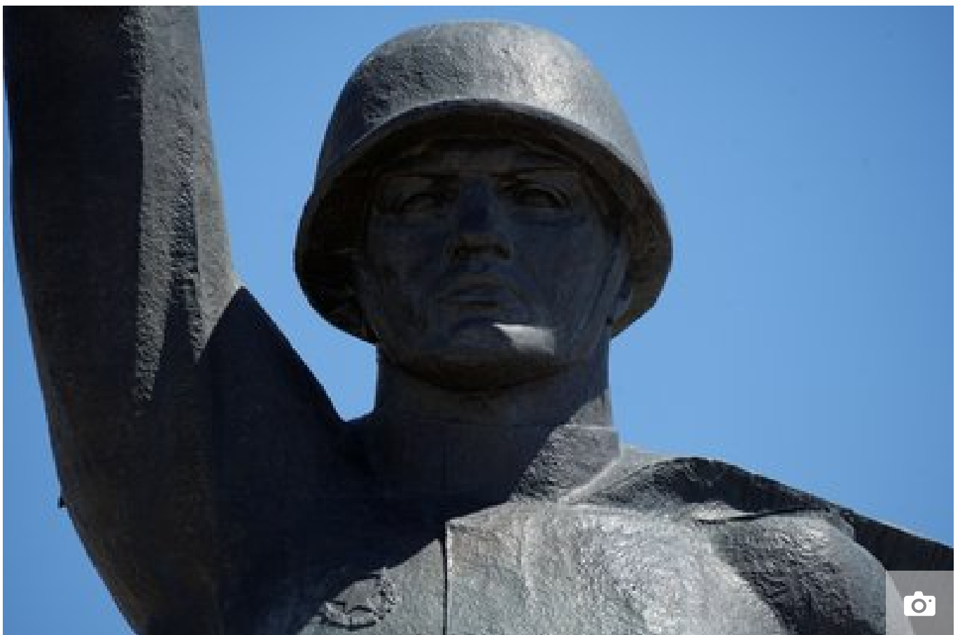
Пам'ятник радянським воїнам-визволителям біля метро "23 серпня", червень 2024 року, Харків.

"Усі пам'ятники монументального мистецтва, які стосуються саме "Великої вітчизняної війни" формувалися й встановлювалися саме з метою просування міфу про "Велику вітчизняну війну". Відповідно, це елемент монументальної пропаганди, але, очевидно, розглядати питання демонтажу цього пам'ятника ми можемо після висновку, який можуть надати фахівці нашого інституту", — каже Тахтаулова.