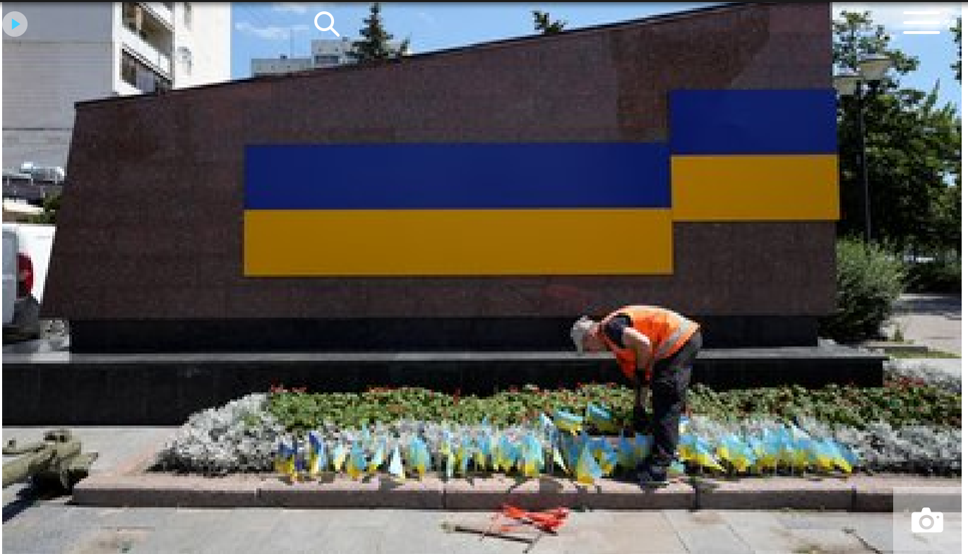
Стела біля Пам'ятник радянському солдату, червень 2024 року, Харків.

Однак рішення про його знесення можуть ухвалити й на місцевому рівні, каже очільниця Інституту нацпам'яті.