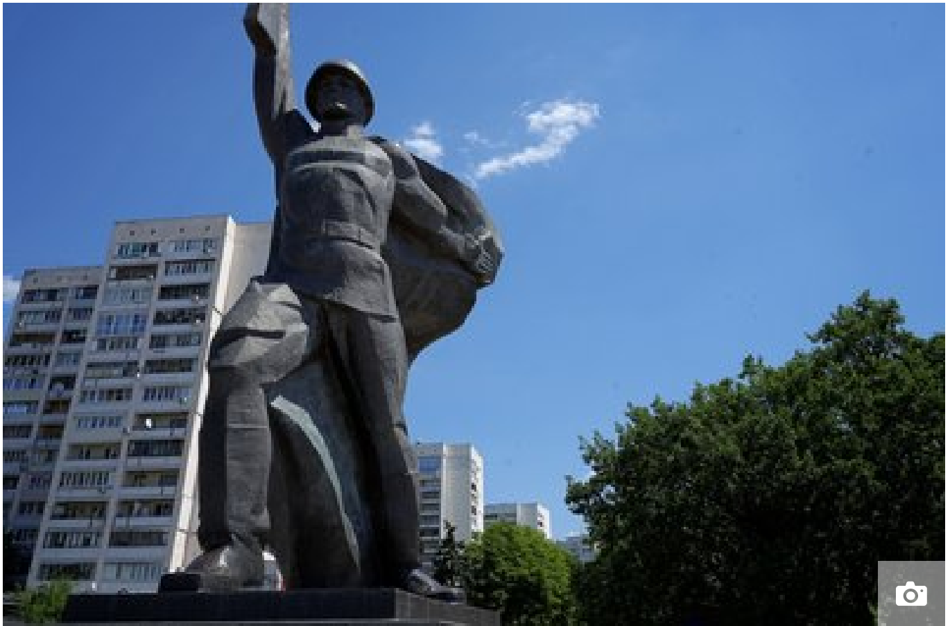
Пам'ятник радянським воїнам-визволителям біля метро "23 серпня".

"Це пам'ятник, до речі, був одним із символів російської пропаганди під час цієї нової спроби наступу на Харків. Вони використовували його в усіх своїх можливих агітках як образ так званого "солдата-визволителя", використовували саме як символ звільнення Харкова від "українацистів", тобто проводили аналогію між собою й цим пам'ятником", — каже Поздняков.