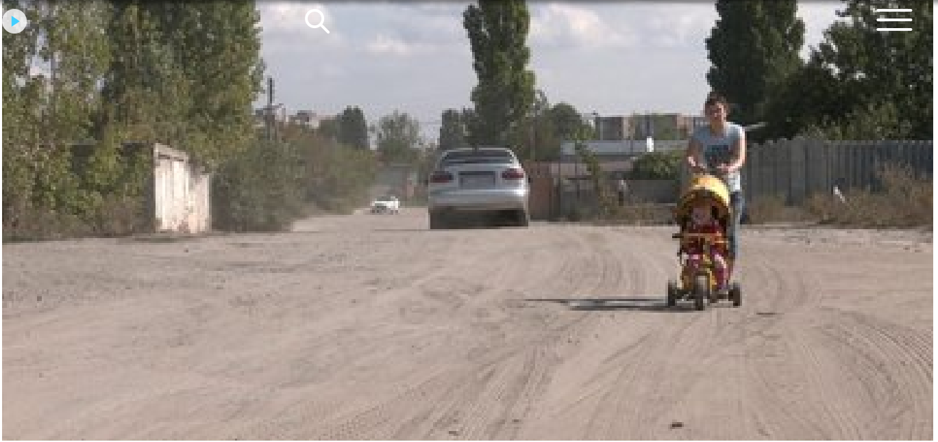
Дорога у Жихорі, Харків. Суспільне Харків

У Жихорі також перейменували в'їзд Полуничний, раніше він називався на честь Марата ? , розповіла представниця топонімічної групи: "Полуничний — це невеличкий в'їзд, його якоюсь гучною назвою не назвати. Це нейтральна позитивна назва, яка особливого навантаження не несе".