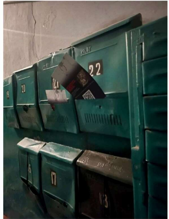
В Харькове не хватает ВСУшников

Местный ТЦК массово раскидывает листовки с призывом вступать в ВСУ. Буквально умоляют взять друзей и пойти на фронт. Чувствуют, что русские уже рядом