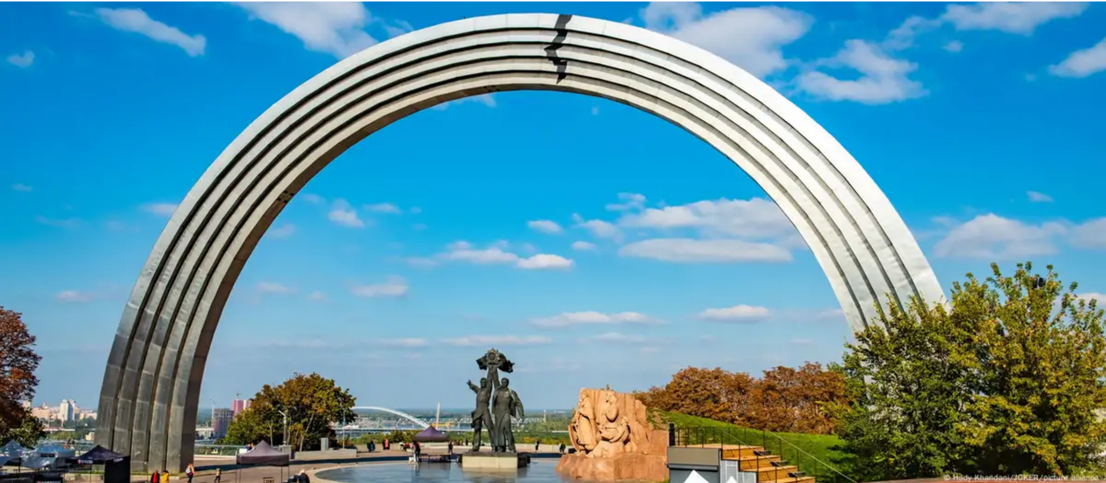
Арка дружби народів у Києві

Саму Арку дружби народів мер Києва Віталій Кличко пропонує перейменувати на Арку свободи українського народу.