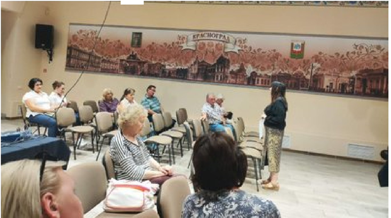
Громадське опитування про перейменування Краснограда, вересень 2023 року.

Міська голова каже, що ініціатива залишити назву Красноград надійшла від містян. У вересні відбулось громадське опитування, на якому 96% жителів проголосувало за те, щоб залишити стару назву. Серед варіантів, запропонованих місцевими, були також Костянтиноград, Берест, Червоноград, Берестин, Фортеця, Зеленоград. Серед них найбільшу підтримку отримав варіант Костянтиноград — майже 2% голосів.