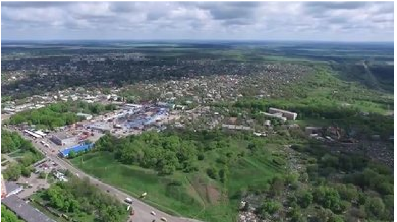
Красноград, Харківська область.