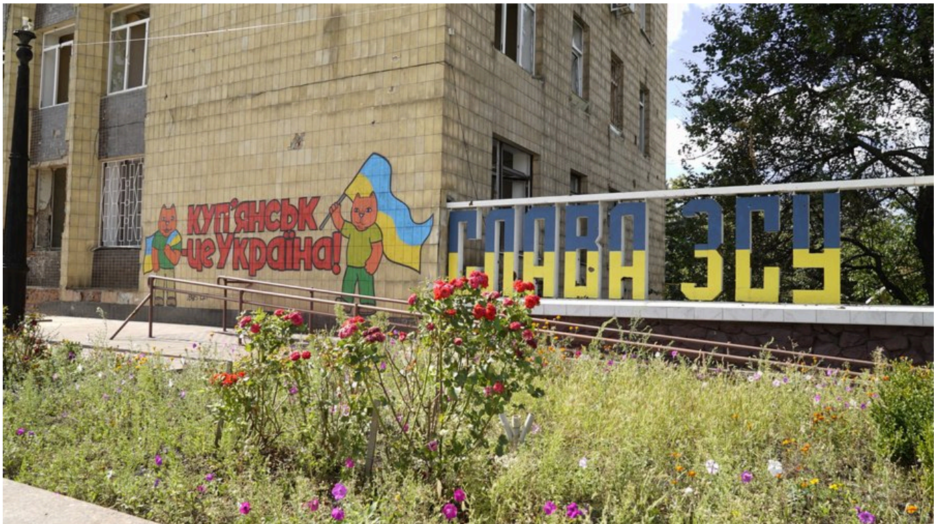
Стінопис, присвячений звільненню в центрі Куп'янська, Харківська область, вересень 2023 року.

Хоча, наприклад, Куп'янськ все одно працює над перейменуваннями. Зокрема, у вересні 2023 року було перейменовано 19 топонімів . Одна вулиця колишня імені Ватутіна і в'їзд стали 10 вересня — це дата звільнення Куп'янська від російської окупації.