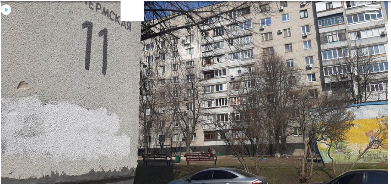
Вулиця Пермська у Харкові. Березень 2023 року.

Якщо ми говоримо про топоніми, назви вулиць, провулків тощо, то по 27 січня 2024 року таке рішення може ухвалити сесія ради або ж розпорядженням голови військової адміністрації.