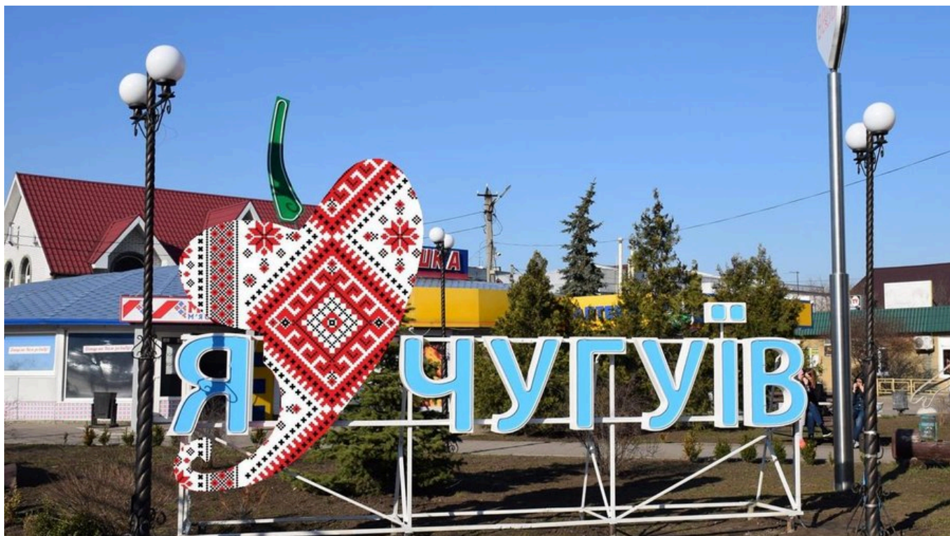
Ілюстративне фото.

На жаль, такого не можу сказати про Чугуїв , де військове училище було кузнею кадрів офіцерського складу столітньої давнини, але, на жаль, там таким підходом похизуватися не можемо.