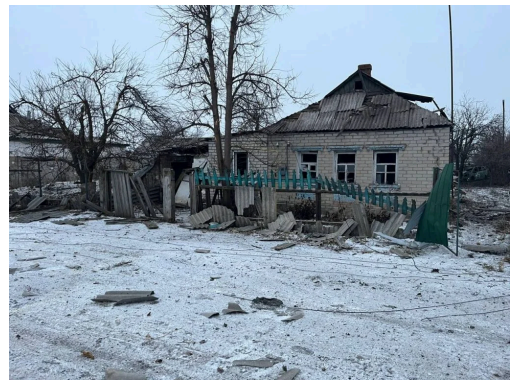
Село Шевченко, наслідки обстрілу 19 грудня 2024 року.

Село Оршанка, Богодухівський район: О 16:15 окупанти обстріляли лісову зону. Руйнувань немає.