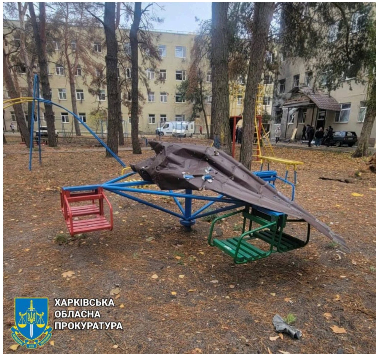
Наслідки влучання дрону в Чугуєві.