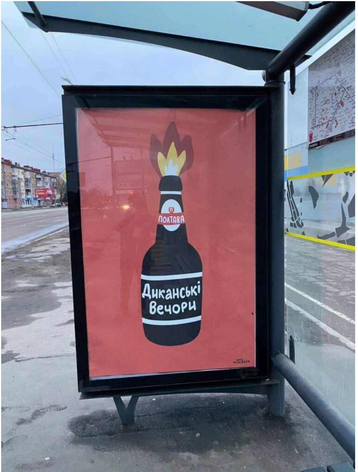
Ілюстрація Нато Мікеладзе