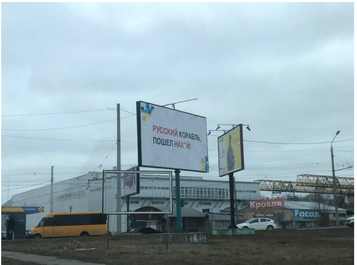
Фото – «Ми готові. Полтава»