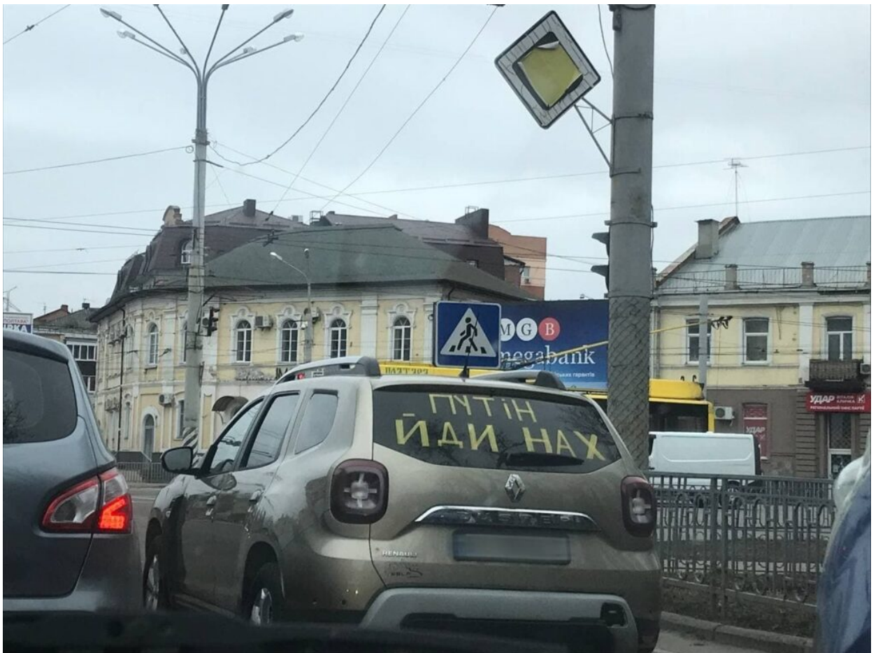
Фото – «Ми готові. Полтава»