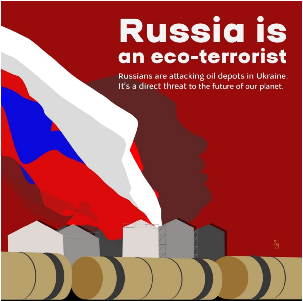
Ілюстрація Юлії Сухопарової

Russians are attacking oil depots in Ukraine. It's a direct threat to the future of our planet.