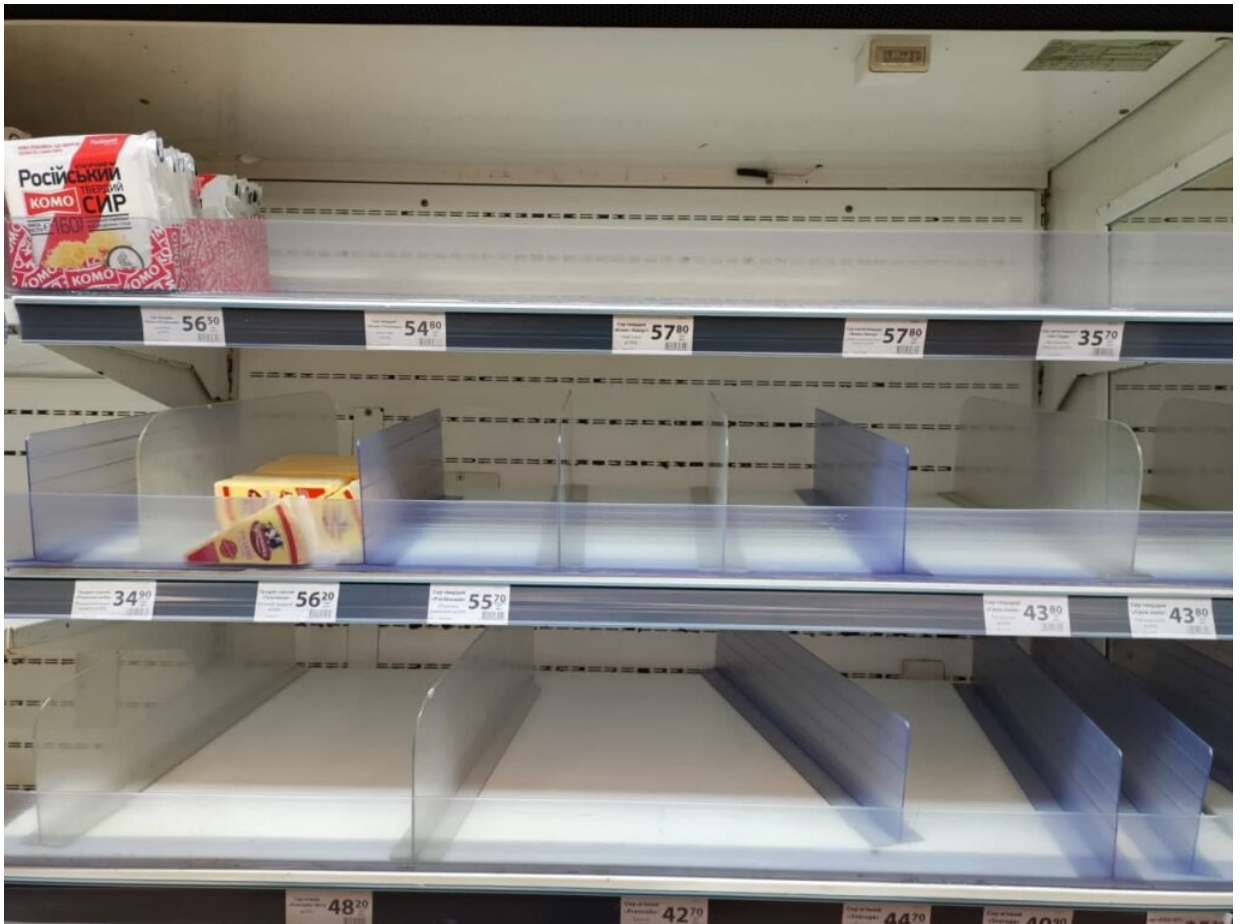
з полтавського супермаркету