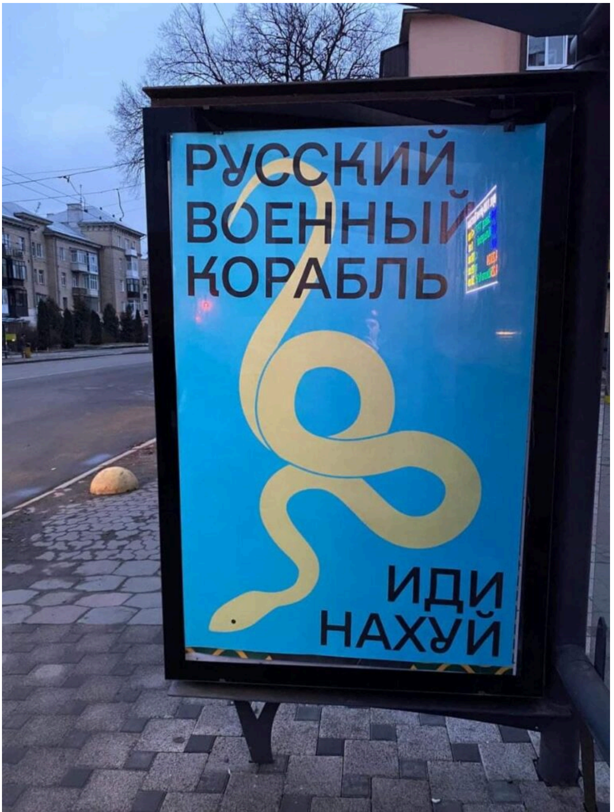
Ілюстрація Нато Мікеладзе