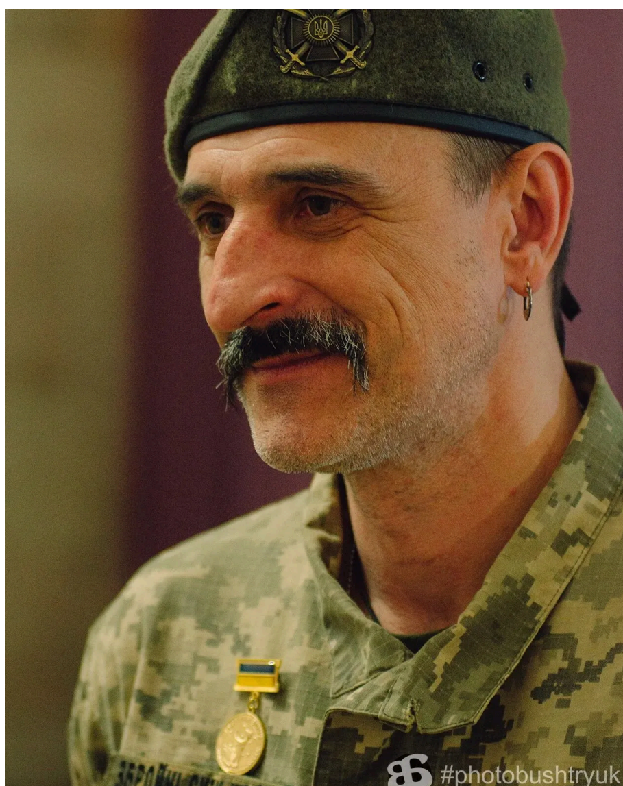
Попри демобілізацію військовий повернувся на фронт.

У розмові з "Детектором медіа" актор зазначив, що повернутися було його свідомим рішенням. "Якщо чесно казати, то я коли звільнявся, був упевнений, що тимчасово знімаю військову форму і через якийсь час повернуся до армії. Я не знав, куди саме повернуся – чи до своєї частини, де починав службу, чи до якоїсь іншої, – але я точно знав, що обов'язково буду у війську поки йтиме ця війна", – розповідав він.