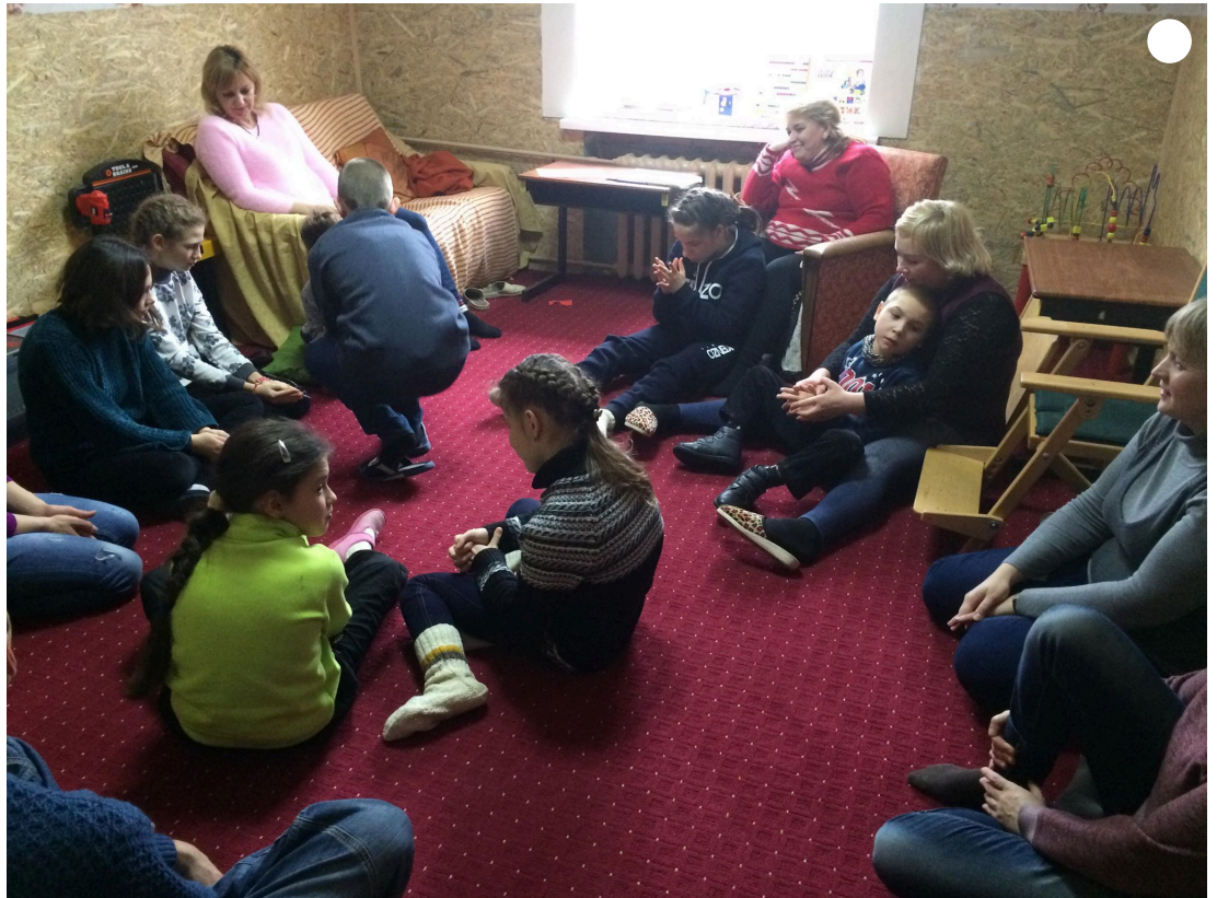
Ігрове заняття з психологом, яке проводить громадська організація "Центр сімейної реабілітації "Софія" для дітей з інвалідністю.

У волонтерів, гуманітарних організацій ми завжди просимо гігієнічні засоби, харчові продукти. Зараз узагалі існує проблема з надходженням гуманітарної допомоги до Херсона: її стає значно менше. Іноземні донори вважають, що в нас є світло, доступ до банків та супермаркетів, тому в нас усе добре. А якщо вас щось не влаштовує – виїжджайте. І це складне замкнуте коло.