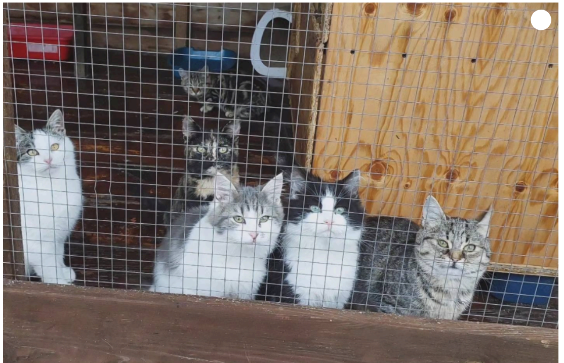
Тварини, які мешкають у притулку.

На вечір, коли йшла додому, бачила, як наші хлопці зривали російські білборди, люди плакали від радості, й всім було вже байдуже на те, що немає світла і води. Всі посміхалися, бо останній тиждень у місті був сірий і складний. В якийсь момент здавалося, що життя закінчується.