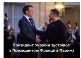
Президент України зустрівся з Президентом Франції в Парижі

Володимир Зеленський подякував Президенту Французької Республіки за його лідерство й висловив сподівання, що Франція підтримає принципове спільне рішення союзників щодо формування «коаліції винищувачів», на яке вже тривалий час очікує Україна.