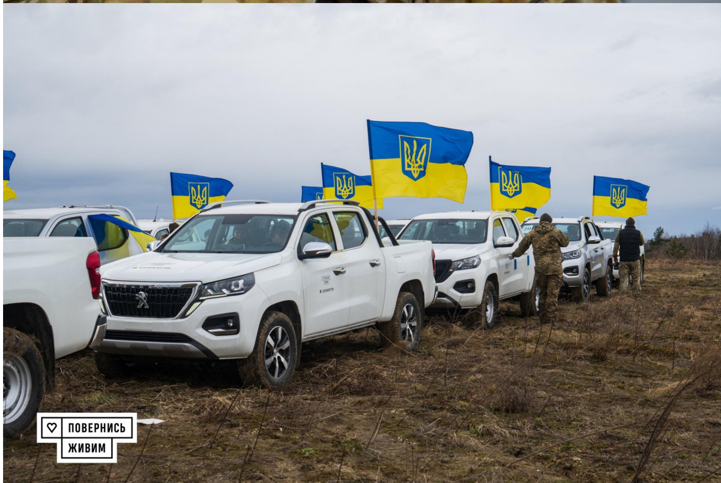
Фонд забезпечив близько 600 МВГ

Фонд передав підрозділам протиповітряної оборони: