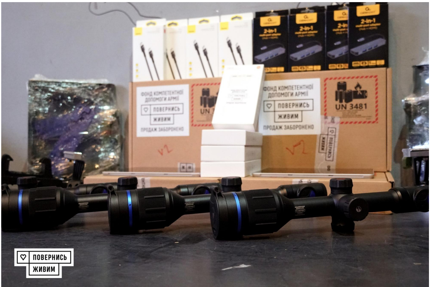
Фонд забезпечив близько 600 МВГ

Додамо, що фонд підсилював протиповітряну оборону України з 2016 року. Зокрема, допомагав підрозділам ППО Сухопутних військ із ремонтом та модернізацією зенітних ракетних комплексів, обладнанням пунктів управління, сучасним зв'язком. Це посилює готовність воїнів до відбиття масованих атак у перші критичні тижні повномасштабного вторгнення Росії в Україну у 2022 році. Відтоді Фонд розширив допомогу протиповітряній обороні й на Повітряні сили.