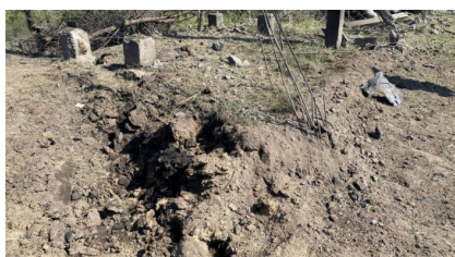
ФОТО Останнє оновлення: 18 тра...

Важливо! Навіть при успішній роботі протиповітряної оборони, уламки збитих у небі ракет обов'язково повертаються на землю і становлять серйозну загрозу життю людей. Під час повітряної тривоги дотримуйтеся правил безпеки.