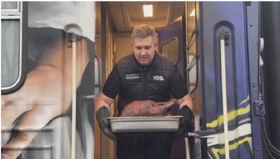
На День подяки Food Train "Укрзалізниці" готував для жителів Харківщини, 28 листопада 2024 року. Суспільне Харків