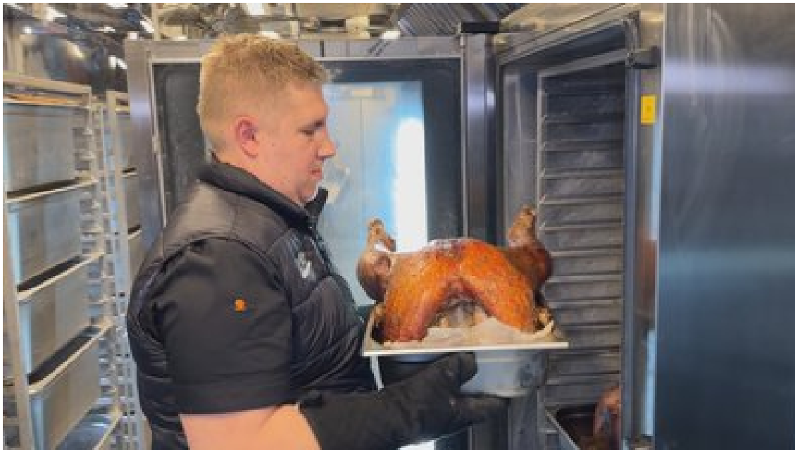
На День подяки Food Train "Укрзалізниці" готував для жителів Харківщини, 28 листопада 2024 року. Суспільне Харків

Про це Суспільне Харків розказав керівник благодійного фонду "Європейське серце України" Максим Корнієнко.