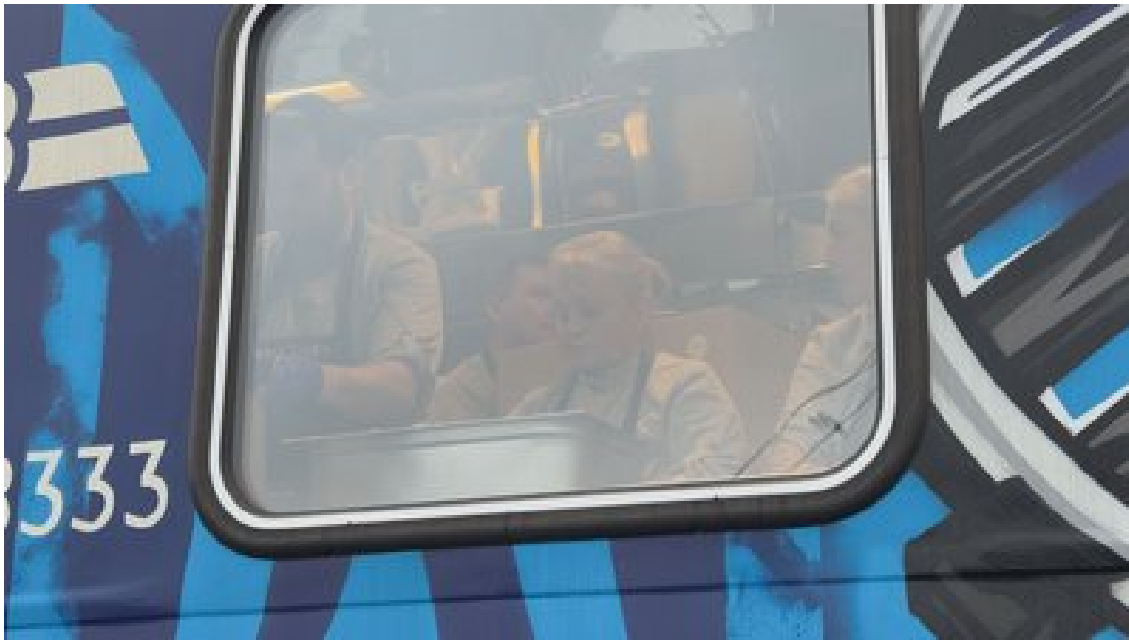
На День подяки Food Train "Укрзалізниці" готував для жителів Харківщини, 28 листопада 2024 року.