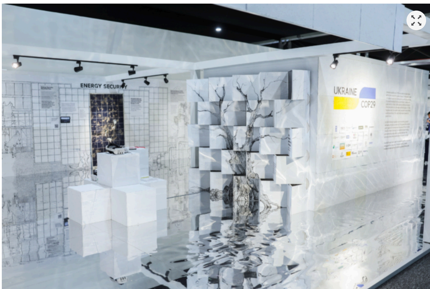
Український павільйон на конференції.

Як зазначають журналісти видання "Ліга", після завершення COP29 фрагменти стін висадять у країнах-партнерах.