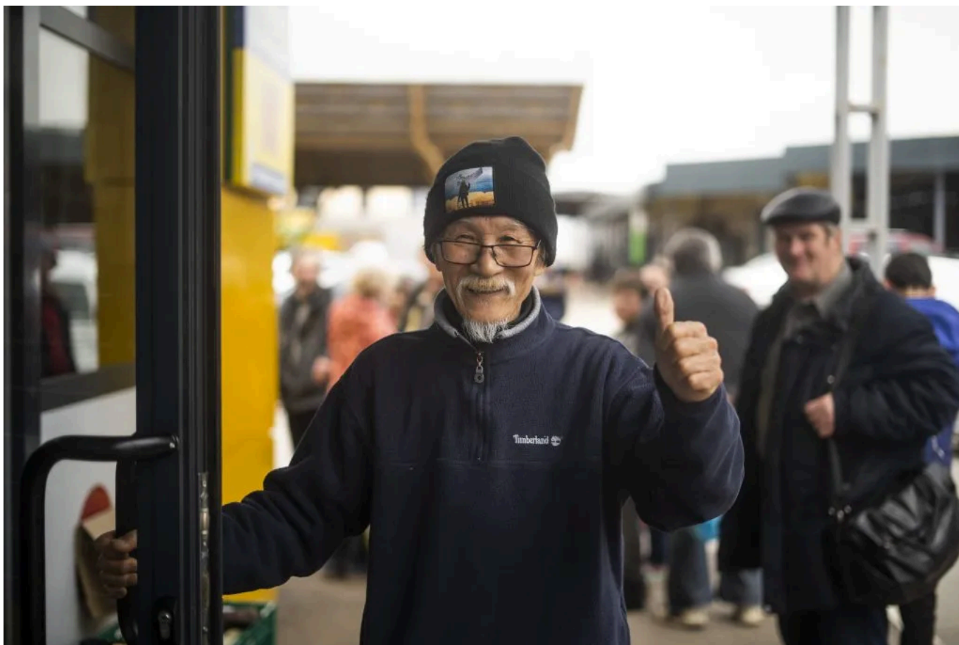
Фумінорі вирішив залишитися у Харкові, він ні про що не шкодує.

«Я продав свій дім в Японії й частину грошей віддав своїм дітям. Доньки мені кажуть: “Тату, будь обережним!”. Моя дружина померла 15 років тому, я один у світі. Але я вільний! І це добре», — розповідає він.