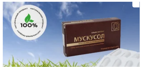
За 3-5 днів застосування лібідо підвищиться, простатит зникне!

Як розповіли у СВА, Один з них передали для потреб житлово-комунального господарства в Золочеві, другий забезпечуватиме безперебійну роботу комунальників у Феськах.