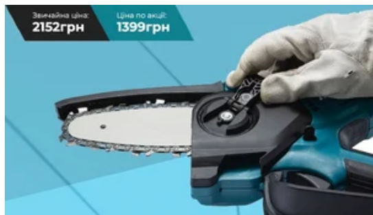
Міні-пила на акумуляторі. Повний комплект! Ціна 1399