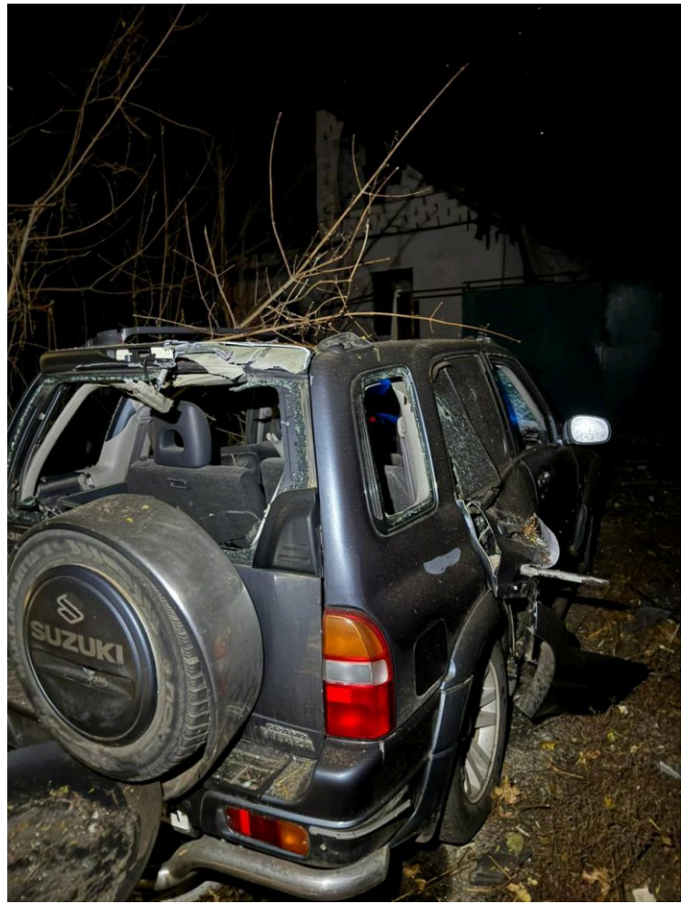
Наслідки обстрілу Харківщини.