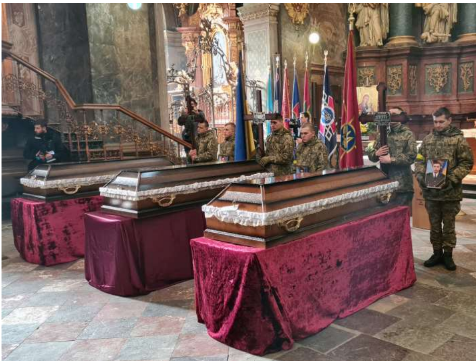
Похорон українських воїнів у гарнізонному храмі Святих Петра і Павла в Львові, 9 березня 2022 року, фото: УГКЦ / Тарас Бабенчук

Вчора ми почули з уст Президента України, що, на жаль, щодня на фронті гине від 50 до 100 українських військовослужбовців... а кількість загиблих цивільних в десятки разів більша. Отже, щодня Україна отримує нову небесну сотню.