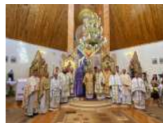
«Бог йому дав серце і душу українського народу»: відбулася щорічна проща до Прилбичів з нагоди уродин