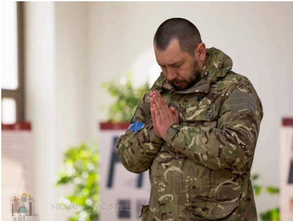
Військовослужбовець молиться в Патріаршому соборі Воскресіння Христового, 27 березня 2022 року

Я запрошую всіх, хто мене сьогодні чує, долучитися до щоденної спільної, всецерковної молитви за Україну о 21:00 за київським часом (о 20:00 за римським часом). Молімося разом за живих і померлих в Україні. Молімося разом за припинення цієї війни і за мир у нашій Батьківщині. До цього закликав Отець і Глава УГКЦ Блаженніший Святослав у щоденному вогненному відеозверненні у 86-й день повномасштабної війни росії проти України.