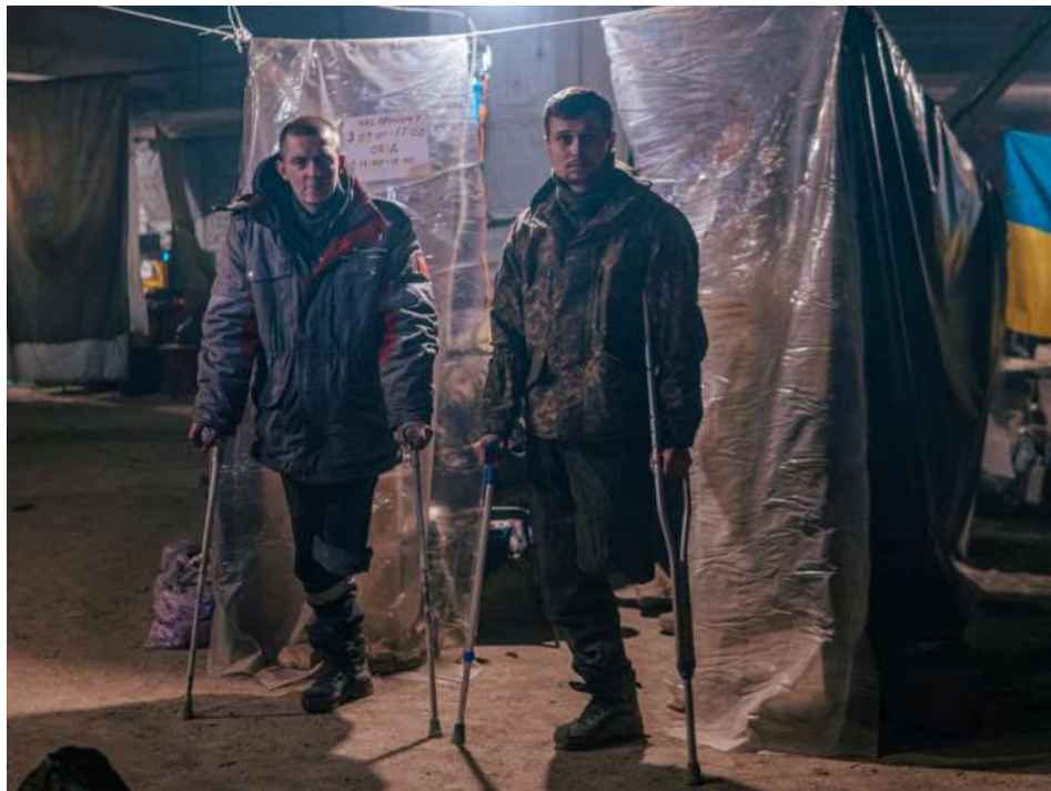
Поранені в бункерах «Азовсталі» в Маріуполі, фото: Полк «Азов»