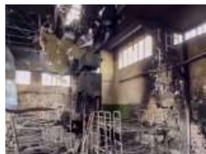
Глава УГКЦ у 157-й день війни: «В ім'я Боже ми засудуємо звірства в Оленівці і світ повинен це»