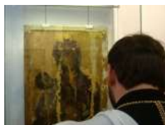
«Боже, почуй наш плач і поспіши нам на допомогу і порятунок!», – Глава УГКЦ у 156-й день війни