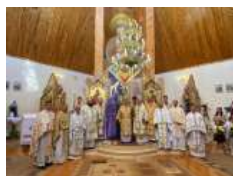
«Бог йому дав серце і душу українського народу»: відбулася щорічна проща до Прилбичів з нагоди уродин