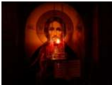
Глава УГКЦ у 158-й день війни: «Нехай Господь прийме з уст нашої Церкви псалми та моління за всіх