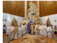
«Бог йому дав серце і душу українського народу»: відбулася щорічна проща до Прилбичів з нагоди уродин