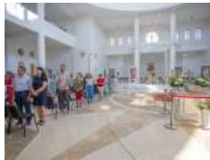
«Сила, яка походить із вірності Христові, є стержнем, який ніхто не може зламати», –