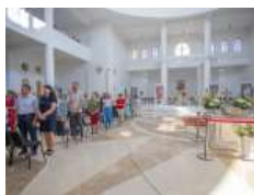
«Сила, яка походить із вірності Христові, є стержнем, який ніхто не може зламати». –