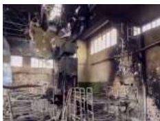
Глава УГКЦ у 157-й день війни: «В ім'я Боже ми засудуємо звірства в Оленівці і світ повинен це