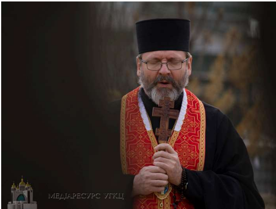
Блаженніший Святослав під час молитви за невинно вбитих російськими окупантами українців, Буча, 7 квітня 2022 року

Любити ближнього означає усвідомлювати і переживати свою людськість, а відтак виявляти свою людяність. Тому кожен християнин, незалежно хто він: німець, італієць, австралієць, бачачи звірства окупантів у Бучі, каже сьогодні: я – українець, відчуваючи єдність у людському нашому роді з тими безневинними жертвами. Про це сказав Отець і Глава Української Греко-Католицької Церкви Блаженніший Святослав у своєму щоденному воєнному зверненні у 44-й день війни.