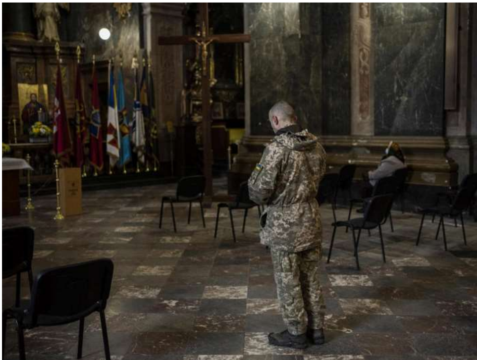
Молитва у Гарнізонному храмі Святих Петра і Павла у Львові, 6 березня 2022 року, фото: AP/Bernat Armangué