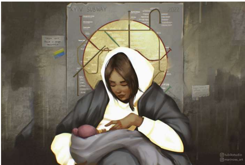
Київська мадонна / Ілюстрація: Марина Соломенникова

Коли ми говоримо про нашу Батьківщину, нашу Україну, яка стоїть, бореться, перед очима постає постать жінки як символу України, як тієї, яка бере на себе невимовний тягар війни, яка серед моря смерті чуває над життям, яка будує і захищає майбутнє. Про це сказав Отець і Глава Української Греко-Католицької Церкви Блаженніший Святослав у своєму щоденному воєнному зверненні на 22-й день війни росії проти України.