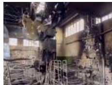
Глава УГКЦ у 157-й день війни: «В ім'я Боже ми засудуємо звірства в Оленівці і світ повинен це