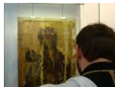
«Боже, почуй наш плач і поспіши нам на допомогу і порятунк!»», – Глава УГКЦ у 156-й день війни