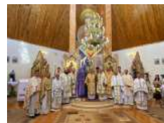
«Бог йому дав серце і душу українського народу»: відбулася щорічна проща до Прилбичів з нагоди уродин