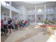
«Сила, яка походить із вірності Христові, є стержнем, який ніхто не може зламати», –