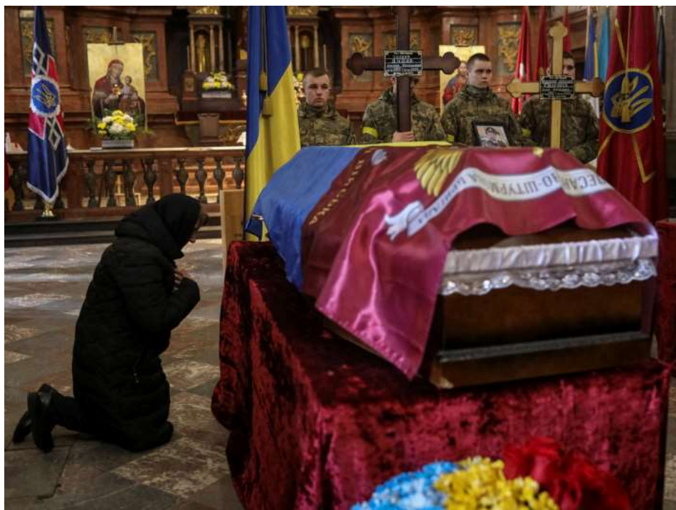
Похорон захисників України у Гарнізонному храмі Святих апостолів Петра і Павла у Львові, 8 березня 2022 року

Помолімося сьогодні за тих, над ким не лунали церковні дзвони, які неоплаканими були складені в братські могили. Помолімося за тих, над ким не лунала християнська заупокійна молитва. Виявімо наше милосердя до тіл загиблих і збережімо таким чином людину, людську гідність в Україні! До цього закликав Отець і Глава УГКЦ Блаженніший Святослав у щоденному воєнному зверненні в 17-й день війни.