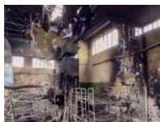
Глава УГКЦ, у 157-й день війни: «В ім'я Боже ми засуджуємо звірства в Оленівці і світ повинен це