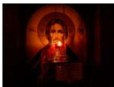
Глава УГКЦ, у 158-й день війни: «Нехай Господь прийме з уст нашої Церкви псалми та моління за всіх