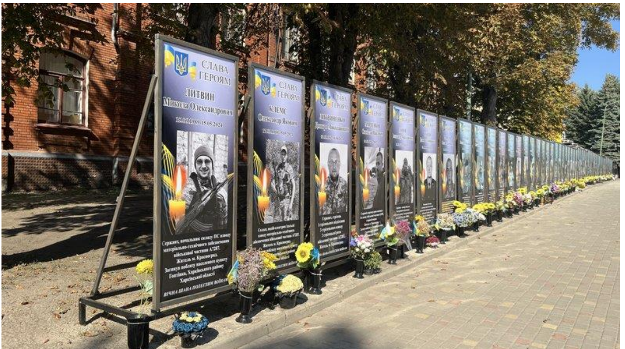
Алея Слави у Краснограді, Харківська область, 20 вересня 2024 року.

А фізичним особам , у кого є документи, право власності будинки, змінювати нічого не треба . Зміни будуть вноситися тільки у разі нотаріальних дій, якщо людина, приміром, буде продавати чи купувати житло, іншу нерухомість. А так людям нічого не потрібно змінювати — ні в паспортах, ні в документах на право власності.