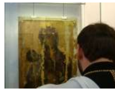
«Боже, почуй наш плач і поспіши нам на допомогу і порятунк!»», – Глава УГКЦ у 156-й день війни