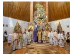
«Бог йому дав серце і душу українського народу»: відбулася щорічна проща до Прилбичів з нагоди уродин