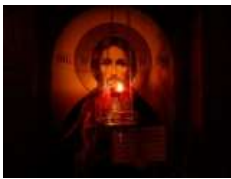
Глава УГКЦ у 158-й день війни: «Нехай Господь прийме з уст нашої Церкви псалми та моління за всіх