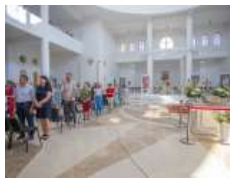
«Сила, яка походить із вірності Христові, є стержнем, який ніхто не може зламати», –