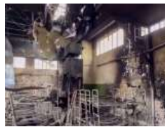
Глава УГКЦ у 157-й день війни: «В ім'я Боже ми засуджуємо звірства в Оленівці і світ повинен це