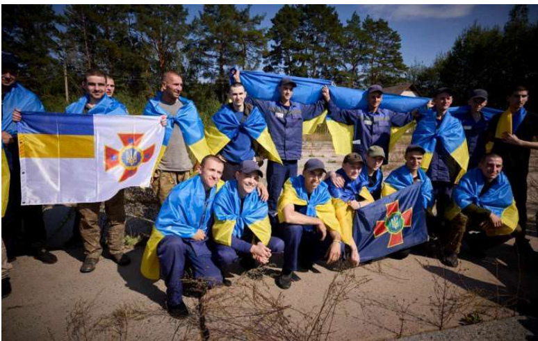
Фото: Володимир Зеленський

Ще 103 українських Воїнів вдалося повернути в Україну з російського полону. Серед них – захисники Київщини, Донеччини, Маріуполя та «Азовсталі».