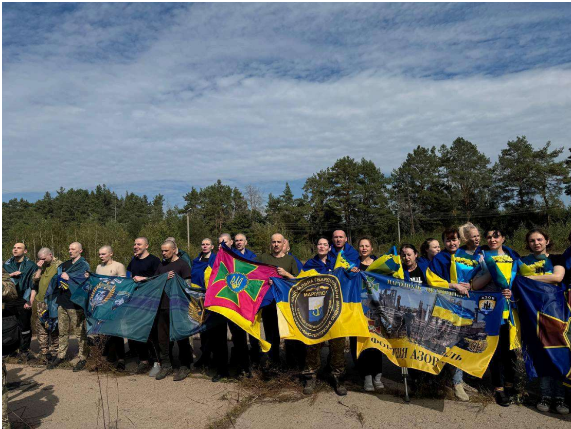
Повернення українок з полону 13 вересня 2024 року.

Зокрема, повернулися жінки, яких росіяни примусили брати участь у так званому «судовому процесі» над захисниками Маріуполя.