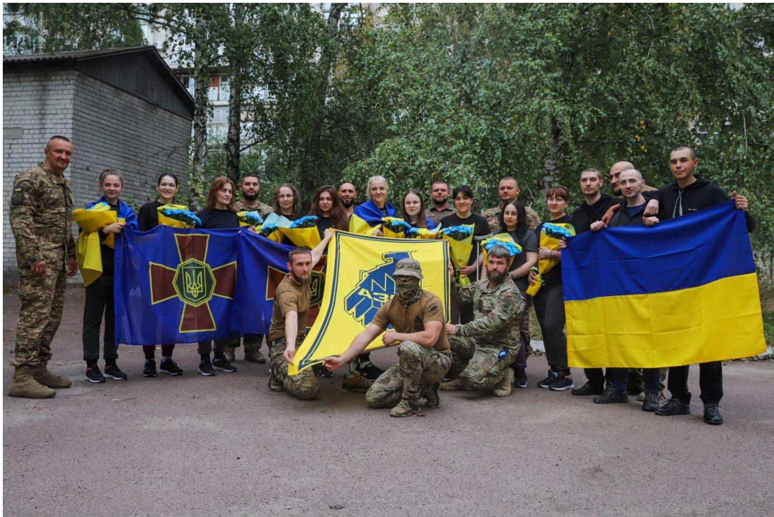
Повернення з полону «азовців».