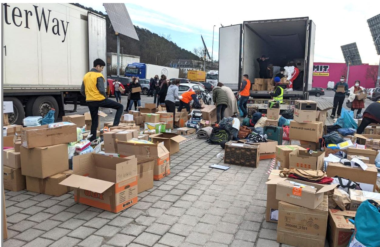
Збір гуманітарної допомоги в Штутгарті