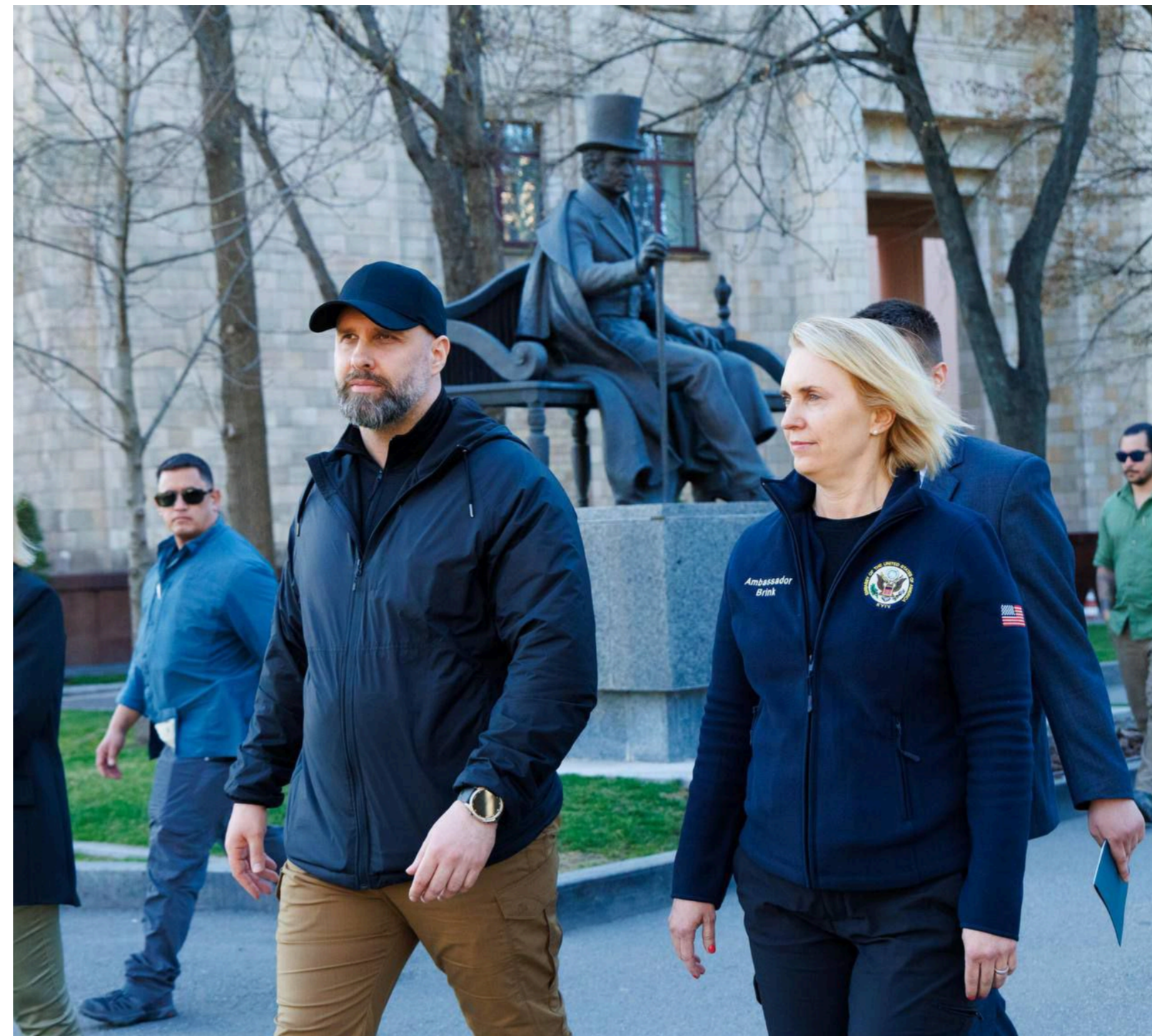
З початку повномасштабної війни США надали Україні понад $65,9 млрд допомоги, зазначають в ОВА.

Водночас у повідомленні ОВА нічого не йдеться про те, яку підтримку втратила Харківщина внаслідок зупинки проєктів Агентства США з міжнародного розвитку (USAID).