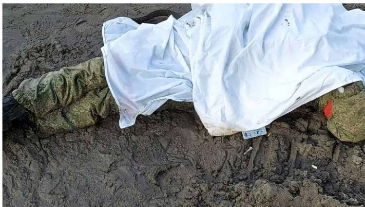
Суми, 26 лютого 2022 року/Фото: Суспільне Суми

"Коли ми їх розбили, наші хлопці пішли подивитися, що вони там везли. Везли парадну форму. За взяття Києва, Харкова, Сум — нагороди вже були готові", — каже Руслан.