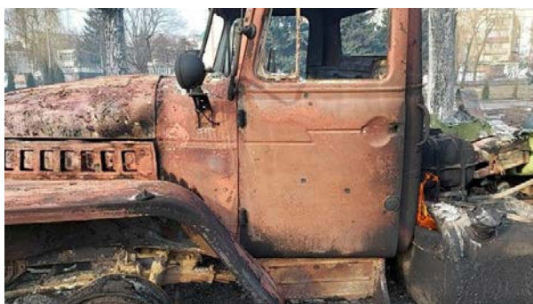
Суми, 26 лютого 2022 року

На кадрах, знятих 26 лютого, – залишки російських вантажівок та бензовозів.