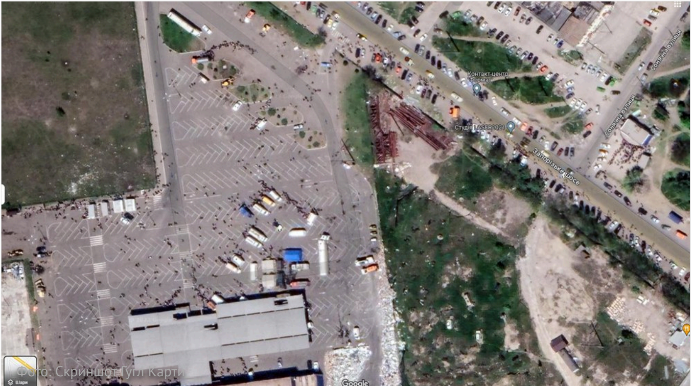
Черги за гуманітарною допомогою біля МЕТРО в Маріуполі. Весна 2022 р.

намагалися знести все артилерією перед тим, як заходити. Це все проспектом Миру котилося від нас у бік будівлі ДТСААФ та Азовсталі.