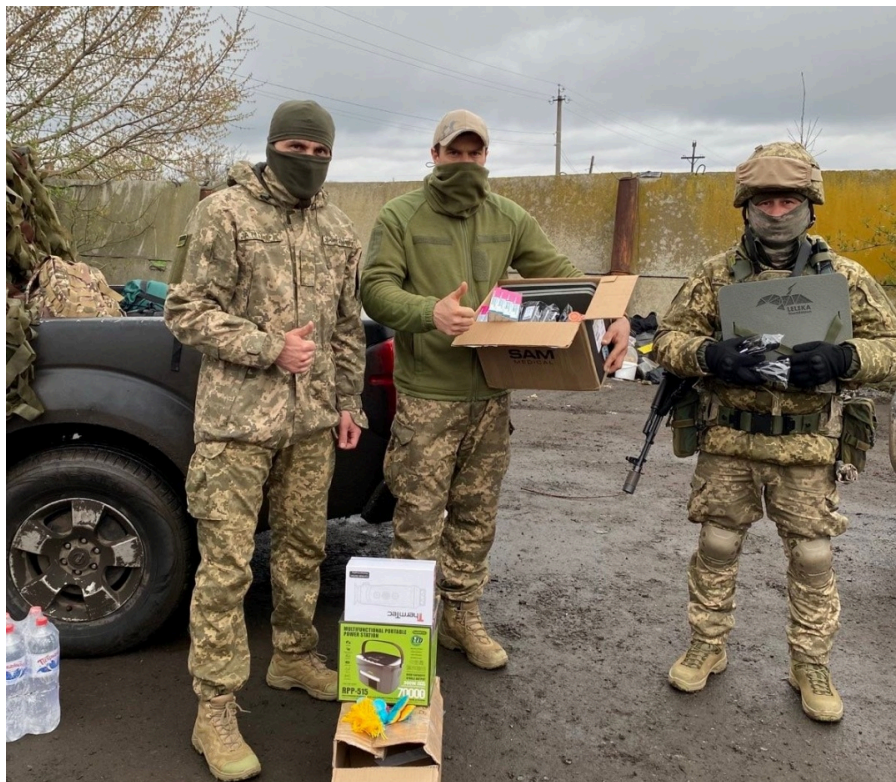
Бійці отримали допомогу від "Лелека-Україна".

«З одного боку, це дуже сумно, тому що загрози існуванню країни нікуди не поділися і не зменшилися, а з іншого – це природна, очікувана тенденція», – говорить вона.