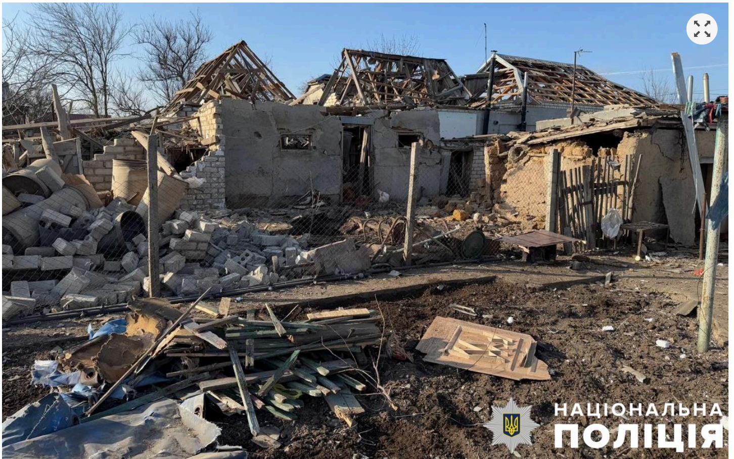
Наслідки російської атаки на Херсонщині

Крім того, на Херсонщині війська РФ завдали ударів по більш як 40 населених пунктах. Під вогнем та авіаударами росіян опинилися Антонівка, Понятівка, Придніпровське, Садове, Софіївка, Приозерне, Білозерка, Томина Балка, Олександрівка, Дніпровське, Зеленівка, Інгулець, Інженерне, Кізомис, Комишани, Микільське, Молодіжне, Берислав, Миколаївка, Милове, Михайлівка, Качкарівка, Монастирське, Новокаїри, Новоолександрівка, Ольгівка, Осокорівка, Республіканець, Львове, Крупиця, Токарівка, Тягинка, Хрещенівка, Червоний Маяк, Шилова Балка, Новоберислав, Новорайськ, Гаврилівка, Бургунка, Козацьке, Веселе та місто Херсон.