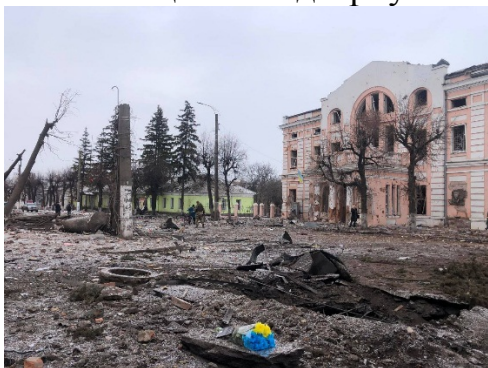
Руйнування в Охтирці, 9 березня 2022 року

Тоді в коридорі зіткнулися два колісних крісла: в одному сидів російський солдат, а в іншому — хлопчик, який постраждав від обстрілів з гранатомета. Коли вони зрівнялися, лікарі сказали російському солдату, мовляв, дивись, з ким ви воюєте — з дітьми! На що той відвернув голову і промовчав.