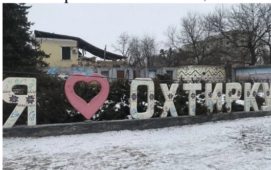
Охтирка, березень 2022 року